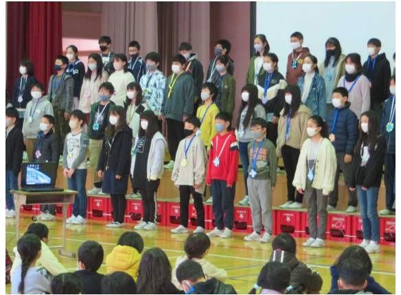
プレゼントのメダルを胸に歌を届ける6年生

5年生の新役員は初めての司会で緊張したと思いますが、はきはきと話し雰囲気を盛り上げてくれました。また、体育館中に飾られた花やメッセージから、温かな気持ちが伝わってきました。全校がワンチームとなり、心に残る会になりました。