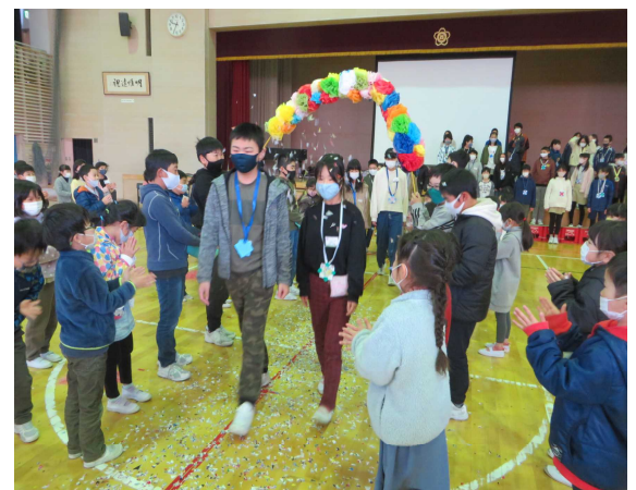
6年生を温かい拍手で見送る