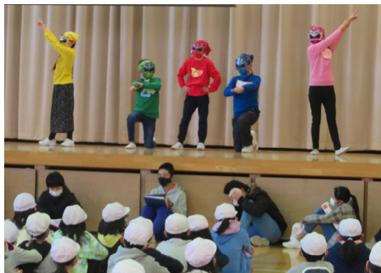
ガンバレんジャーと楽しんだえがお集会

明日は、第148回卒業式が挙行され、60名の卒業生が、西小を羽ばたいていきます。児童会では「ワンチーム～思いをひとつに～」をスローガンに、全校が仲よく楽しい生活を送れるように取り組んでくれました。