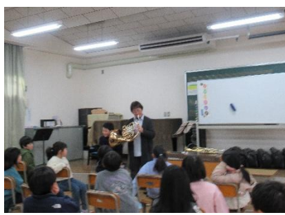
金管楽器鑑賞授業（3年）