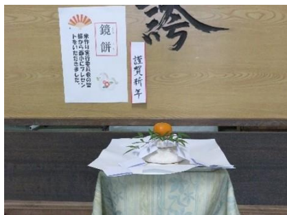
収穫米でつくった鏡餅（5年）