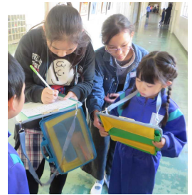
やさしく見守る6年生