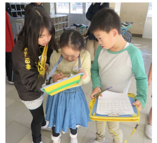
なかよしの輪を広げる

そこで、1学期に大事にしたいことを3つお話しします。1つめは「誰とも仲よく」です。あいさつや声かけを心がけることで、仲よしの輪が広がります。去年のなかよしタイムで、ペア学年の下級生にやさしく声をかける姿がありました。2つめは「いのちを守る」です。今、新型コロナウイルスが流行しているため、自分や友達の命を守るために手洗いを徹底しましょう。手洗いの効果を食パンを使って実験した人がいます。洗ってない手で触ったパンをそのままにしておくと、カビだらけになってしまいました。でも、石けんで洗った手だと1ヶ月たってもそのまま変わりませんでした。石けんで10秒間手を洗うと、99%のウイルスが流されてきれいになるそうです。ぜひ、全校で手洗いに取り組ましましょう。3つめは「自分から動く」です。去年、組体操の練習で5、6年生が技のやり方を教え合っていました。また、無言清掃では床の汚れを見つけて、力を入れて雑巾がけをする姿があり、感心しました。これら3つの「だいじ」に全校で力を合わせて取り組むことで、今のピンチを乗り越えましょう。そして、明日も行きたくなるもっと仲よしの西小学校にしましょう。