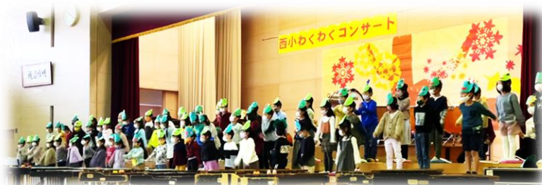
1年生の「かえるジャズ」

新型コロナウイルス感染防止のため、延期や多くの制約がありましたが、11月12日(金)に「西小わくわくコンサート」を実施することができました。感染防止のため、思うような練習ができない中、努力してきた子どもたちも、達成感を味わうことができたのではないかと思います。演奏する子も、聴いている子も、「リズム」に合わせて体を動かしていました。会場全体が「沸き上がるリズム」に包まれ、すてきな時間を皆で過ごすことができました。保護者の皆様には、感染防止のための人数制限、入替制、消毒等にご協力いただきありがとうございました。温かな拍手が子ども達の励みになりました。