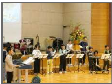
【ウイーアー！ 彼こそが海賊(4,5,6年合奏)】