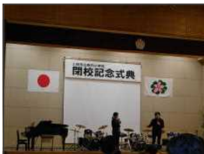
【金管バンドの振り返り】