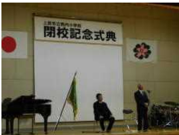
【実行委員長 ご挨拶】