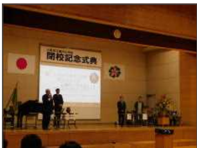
【登り窯 パネルディスカッション】

この閉校記念式典開催にあたり、ご参加いただいたご来賓、歴代校長先生、地域・卒業生の皆様、そして多大なるご尽力をいただきました閉校記念事業実行委員会をはじめ関係者の皆様には、心より御礼申し上げます。おかげさまで思い出に残るあたたかな式典となりました。本当にありがとうございました。150年目のアンカーとして前向きに全力で取り組んでいる子どもたちを今後もご支援ください。よろしくお願いいたします。