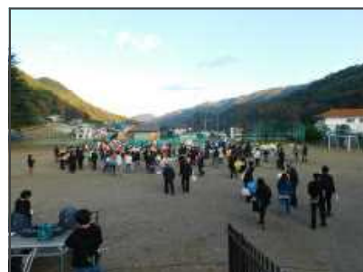
【風船とばしイベント】