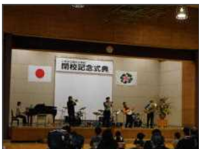
【THE MUSIC BOXさんによる演奏】