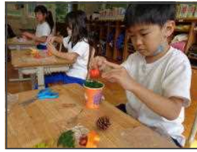
【ハロウィンアレンジメント(10/11)】