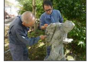
【天女の笛洗浄作業(10/12)】