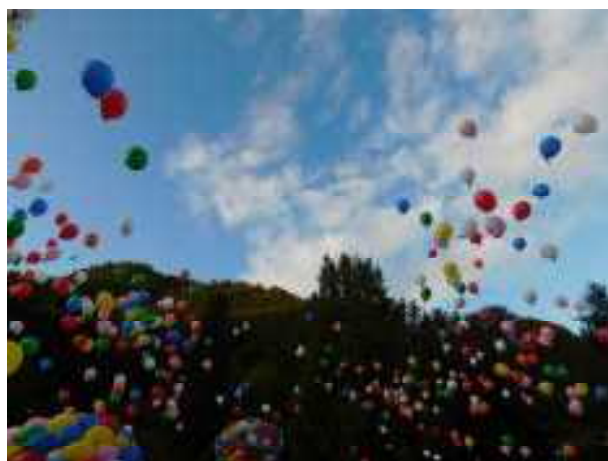
【風船とばしイベント】