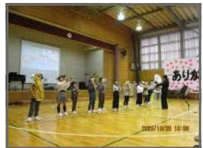
【鎌倉殿の13人のメインテーマ 聖者の行進(金管バンド)】

そして、午後からは、西内小学校閉校記念式典を、上田市長様をはじめ約180名の関係者の皆様にお越しいただき、盛大に執り行いました。