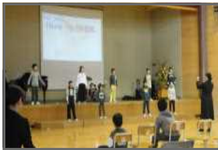
【小さな勇気(4年合唱)】