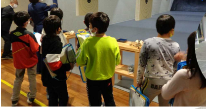
上田警察署の某施設