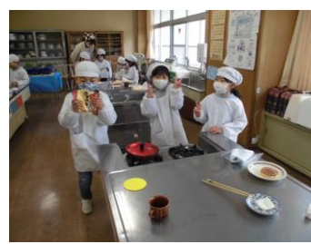
「嬉しくてたまらない！！」

食べるときはもちろん、作っているときも完成したときも、素敵な笑顔で一杯の子ども達でした。新型コロナウイルス感染予防対策に気をつけながら、できる活動を考え、取り組んでいきます。