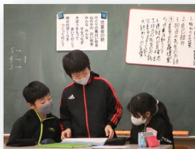
役員で相談しながら