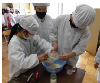
協力して作ります。