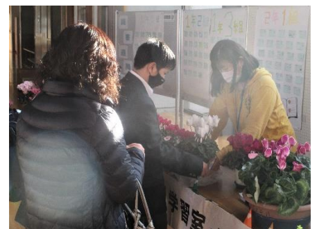
保護者懇談会中の個別学習室・7組・8組 シクラメン販売