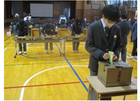
11/25 生徒会役員選挙 立会演説会・投票