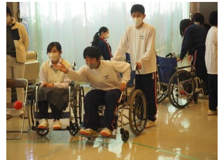
1学年 社協のみなさまを講師に迎えてのアイマスク体験・パラスポーツ「ボッチャ」体験