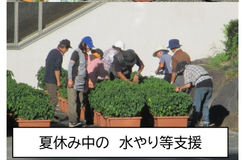
夏休み中の 水やり等支援

昨年度に引き続き、定植・夏休み中の水やり等のお世話をさせていただきました。9月には塩田中環境整美ボランティアのみなさんとの交流もありました。