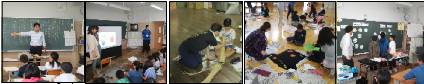
3年生 校外学習の新聞作りについて信濃毎日新聞の方の授業を2回受けました!