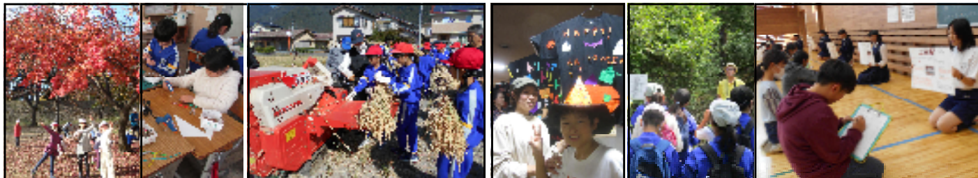
2年生 上田公園で秋探し拾ってきたどんぐり等でパーティーグッズ作り

本校伝統の「ふるさと学習」がフル回転し始めた2学期でもありました。学校から外へ出て学び、外から地域講師の方々に来ていただいて学んだ活動がさかんに行われました。