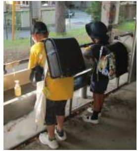
*朝の昇降口での健康観察及び手洗いの様子