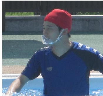
*職員は8月よりマウスシールドを着用し、授業を行っています。