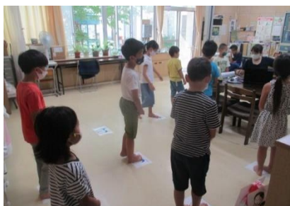
夏休み明けに行われた身体測定