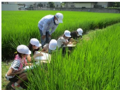
田んぼ観察会が行われました(5年)