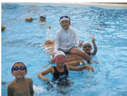
自分たちで作ったペットボトルのイカダを楽しむ2年生。今年は9月4日まで水泳の授業があります。