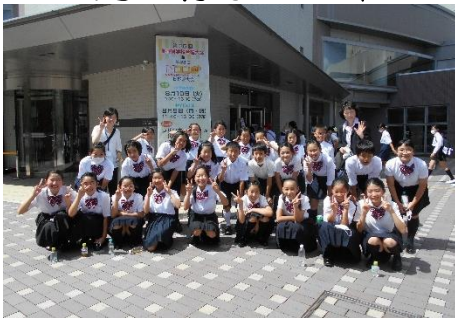
県大会会場前で合唱部員