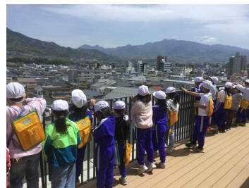
↑ 3年：市役所テラスから