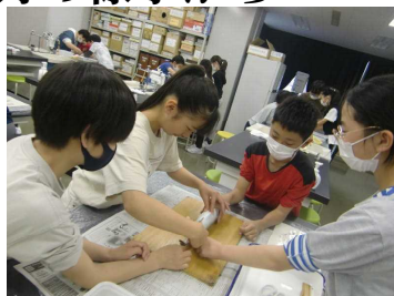
↑ 6年：創造館での学習 ↓