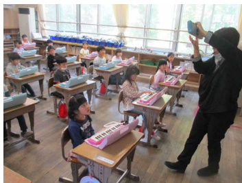
↑ 1年：鍵盤ハーモニカ講習会 ↓