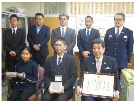
防犯カメラ贈呈式（2/17）

・2月は、各学年の参観日が行われました。一人一研究の発表や学習発表会が行われ、学んだことをアウトプットしていく場となりました。4年生は二分の一人成人式を行い、感動的な式となりました。