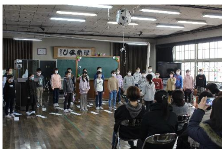
二分の一人成人式（4年参観日）

・2月は、各学年の参観日が行われました。一人一研究の発表や学習発表会が行われ、学んだことをアウトプットしていく場となりました。4年生は二分の一人成人式を行い、感動的な式となりました。