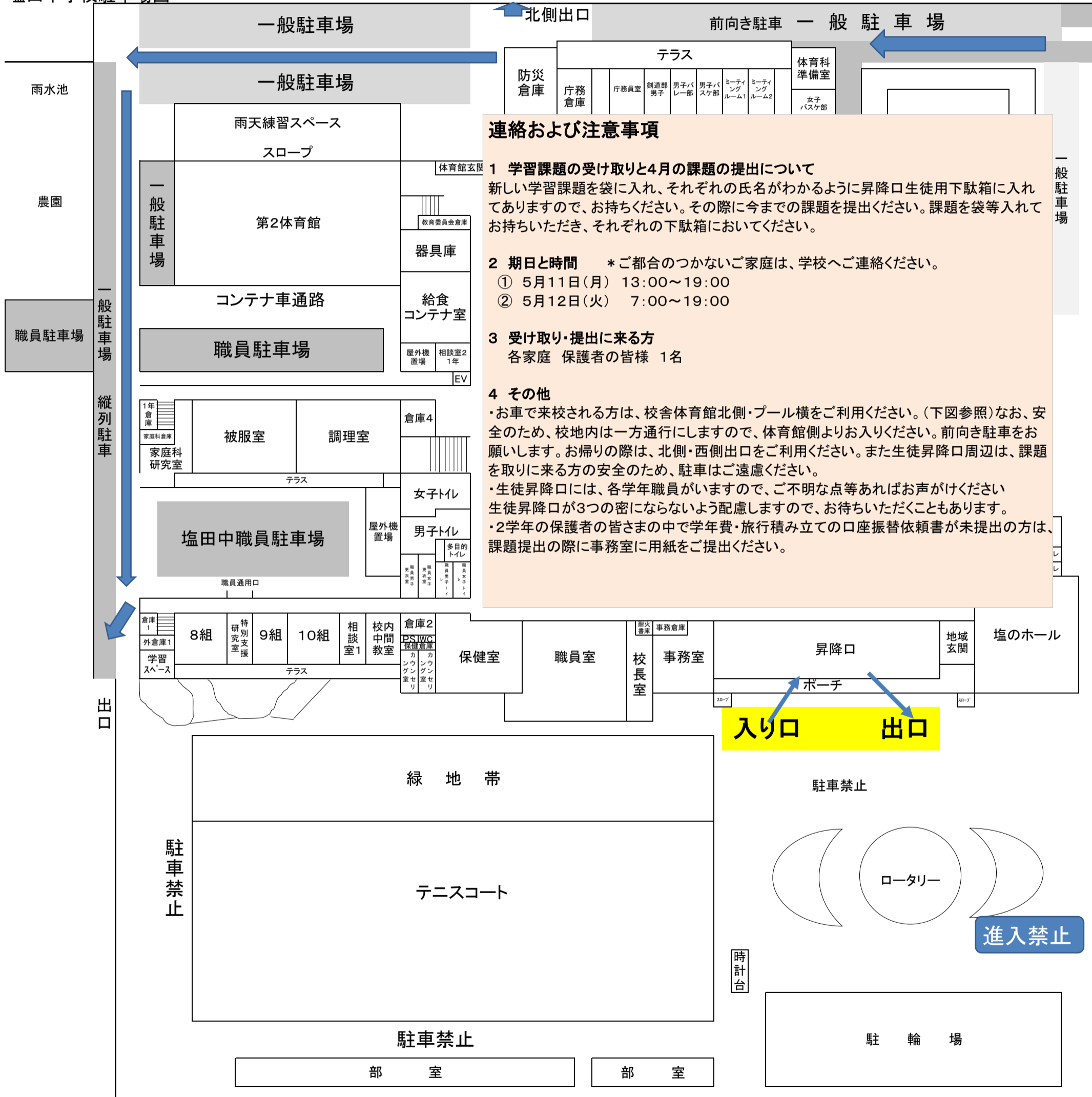
塩田中学校駐車場図

新型コロナウイルス感染症感染防止措置のため、下記のように学習課題の受け取りと提出を行います。保護者の皆様のご協力をいただきます。よろしくお願いいたします。