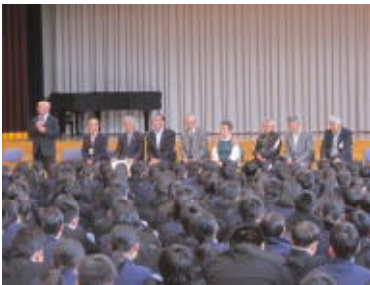
↑しおだっ子応援団紹介式

今年度も、私たち塩田中学校を力強くお支えくださる『しおだっ子応援団』の皆様がスタートしました。私達の学校生活には欠かせない存在として、既に10年以上塩田中学校に根付いている活動となります。