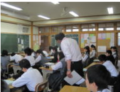
↑学習支援ボランティア

お支えいただいていることへの感謝の気持ちを忘れずに、生活していきたいと思っております。