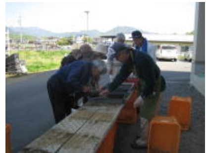
↑花壇定植用の苗作り