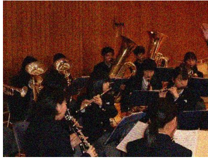
吹奏楽部も演奏で1年生を歓迎