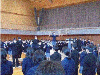
応援・選挙管理委員会による応援