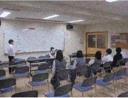
本部役員は意見を出し合い話し合い