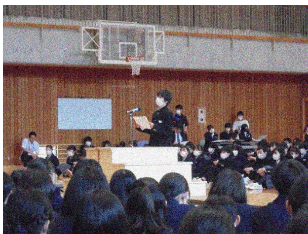
1年生代表によるあいさつ