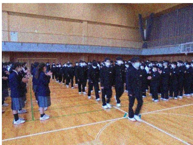
体育館へ入場する1年生

1年生の皆さん、ご入学おめでとうございます。2・3年生は1年生のみなさんが入学してくるのをとても楽しみにしていました。入学式の皆さんの姿は長時間の式でも姿勢を崩さず、とても格好良かったです。いよいよ中学校生活が始まります。不安なこと・分からないことがたくさんあると思います。そんなときはぜひ先輩に頼ってみてください！これから一緒に塩田中を盛り上げていきましょう。