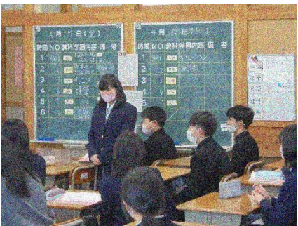
1年生も自己紹介をして仲間入り