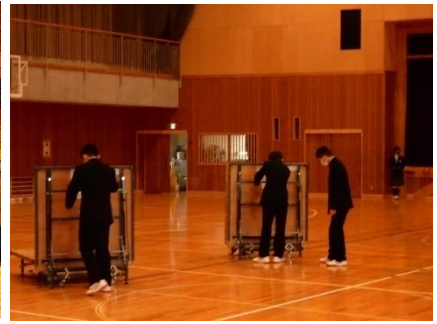
準備と後片付けに手早く行動する生徒会役員