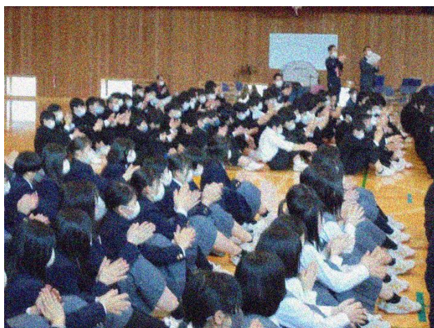
1年生を拍手と合唱で歓迎する2・3年生