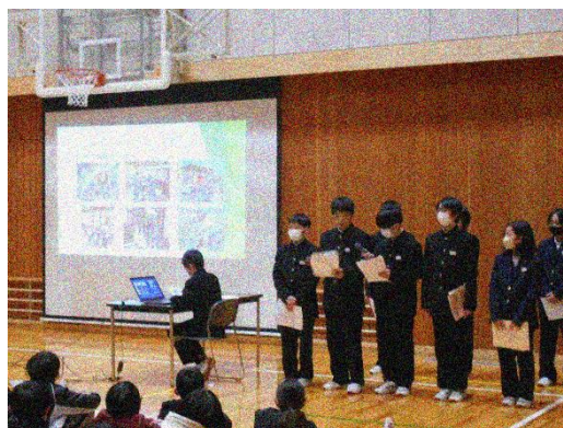
中学校説明会。1年生は小学6年生に中学校の様子を堂々と説明しました。

1学年は小学校6年生が来校した中学校説明会(1月23日)で、歓迎の歌を堂々と歌いました。来年度は先輩になるという意識がさらに強くなりました。新1年生の手本になるように、学習、部活、清掃、生徒会、学級の当番活動など日頃の生活の向上に取り組んでいます。