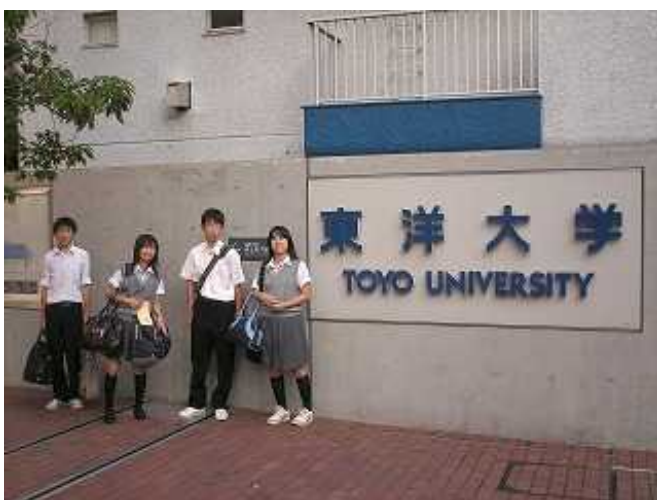
東洋大学白山キャンパス

まあでもここまで良く戦いました。チームを結成してまだ1ヶ月でしたが、決勝トーナメントまで行けたのは本当に素晴らしかったです。