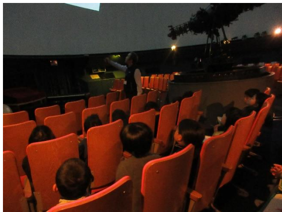
4年生 プラネタリウム

3・4年生ともに、講師の先生の話を中心して聞き、元気よく受け答えしていました。班の友達とも協力して学びを深めていました。