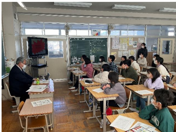
薬物乱用防止教育

と感想を寄せていました。春から進学する6年生、これからの人生でも、正しい知識を持ち、いろいろな誘惑に負けない強い人になってほしいと思います。