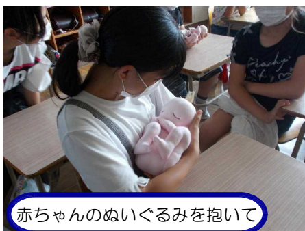
赤ちゃんのぬいぐるみを抱いて