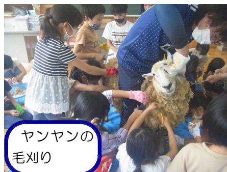
ヤンヤンの毛刈り

「家で家族に話すと、お母さんが『生まれてきてくれて、ありがとう。』と言ってくれました。」