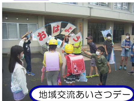
地域交流あいさつデー