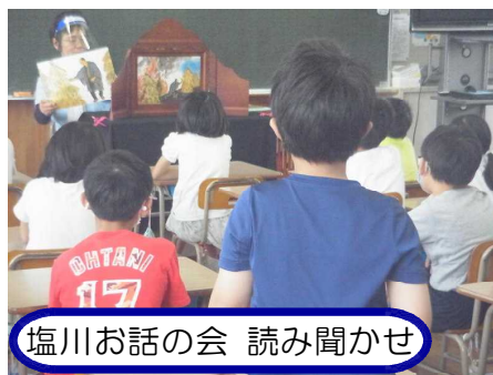
塩川お話の会 読み聞かせ