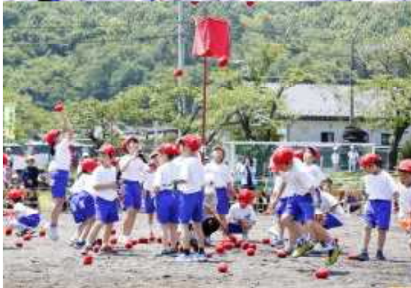
12 玉入れやってみよう！！（ダンス・玉入れ1・2年）