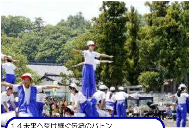
14 未来へ受け継ぐ伝統のバトン ～塩川小150年の道のり～（表現 5・6年）