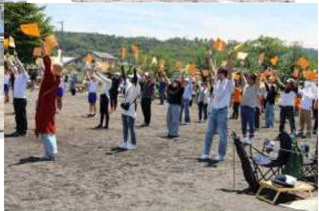
17 150周年記念校歌ダンス （全校・保護者・地域）