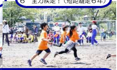
6 全力疾走！（短距離走6年）