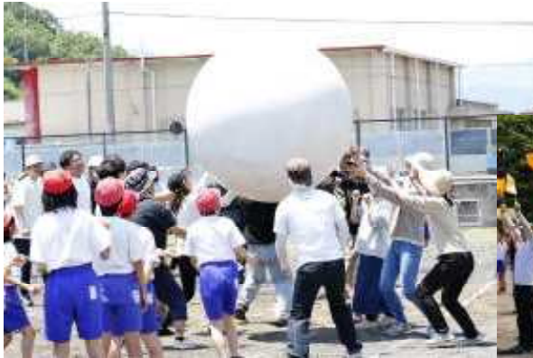
16 150周年記念大玉送り （全校・保護者）