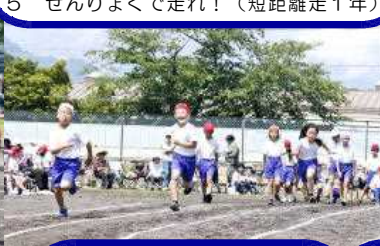
5 ぜんりょくで走れ！（短距離走1年）