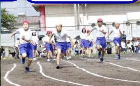
2 ゴールに向かって！（短距離走5年）