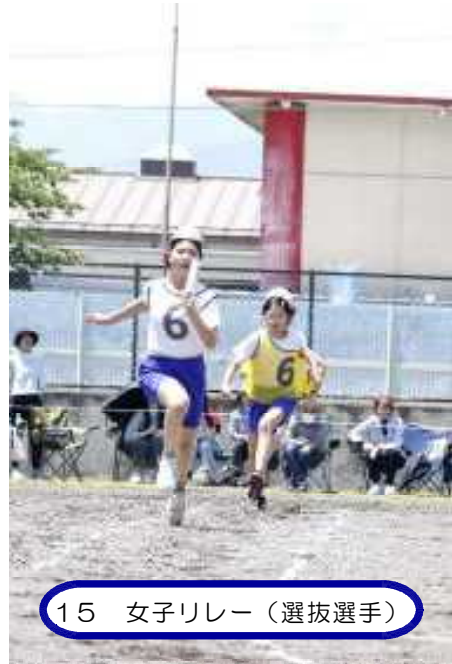
15 女子リレー（選拔選手）