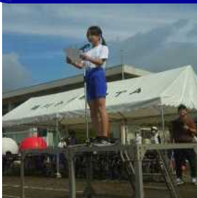
1 開会式・準備体操（全校）