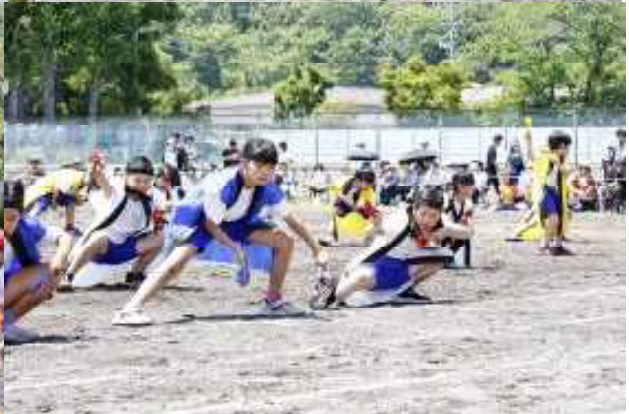
13 塩川ソーラン！2024（表現 3・4年）