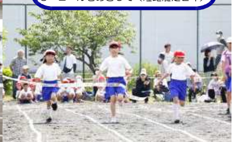
3 ゴールをめざして（短距離走2年）