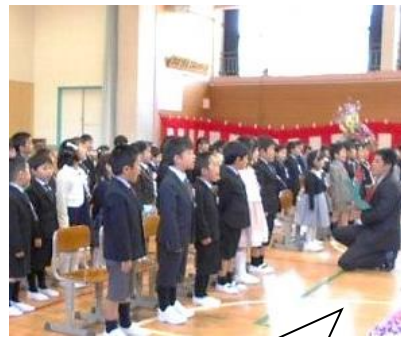
みんなの前で、堂々と歌うことができました。