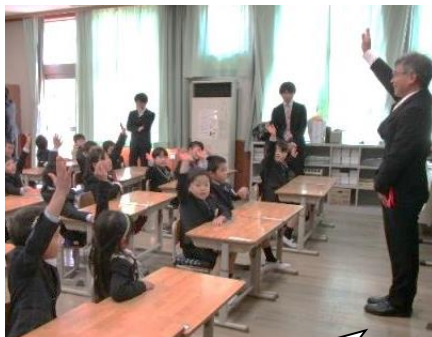
手をしっかりあげて、とても元気です。