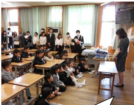
お話を静かに聞いて、えらいです。