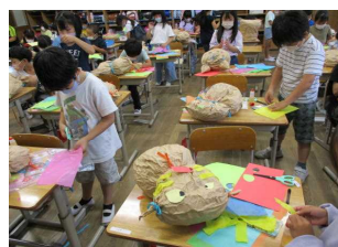
2年 図工「くしゃくしゃ ぎゅっ」

1枚の茶色い紙袋。この紙袋をくしゃくしゃくしゃとしたあと、そこへまたくしゃくしゃくしゃとさせた新聞紙を詰めます。紙袋の端をひもで結んだり、飾りつけをしたりと、自由に発想を広げて制作しました。