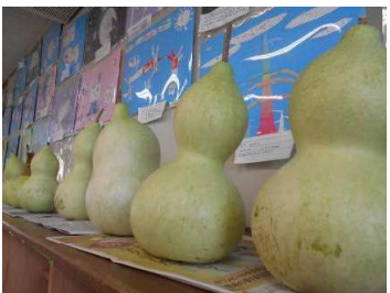
4年 大きな瓢箪がとれたよ