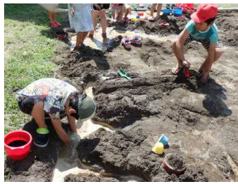
1年 砂遊びは超楽しい!