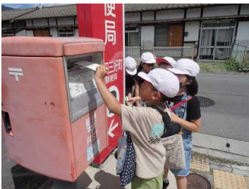
2年 絵手紙を出しました