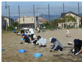
PTA作業お疲れ様でした