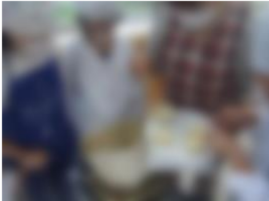
地域の方が先生です。クラブ活動(郷土料理クラブ)