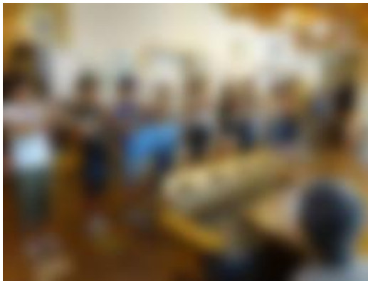
萩の家、萩曲尾グループホームの皆さんと交流(6年生)

【心の相談員・来校日】 毎週火曜日 月1回月曜日 【スクールカウンセラー】 面談を希望される方はご連絡ください。