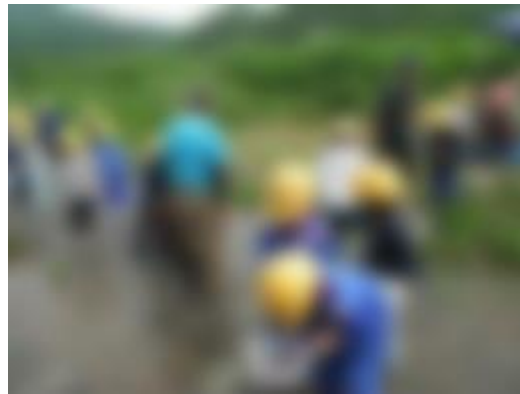
やまぼうし自然学校の皆さんと川遊び(一・二年生)