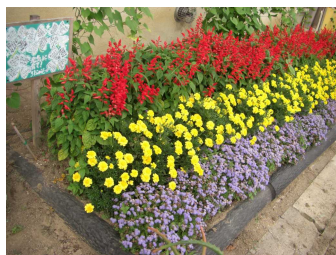
左：サツマイモ畑、中：職員室前、下：図工室前