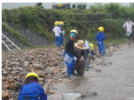
1, 2年 川遊び