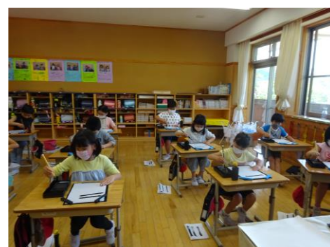
書写 気持ちを集中して