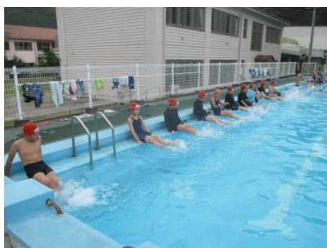
水泳学習 入水前のバタ足