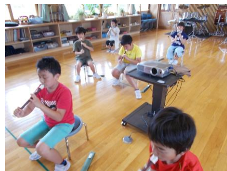
初めてのリコーダー練習

2学期は、8月20日(木)から始まります。全員が元気にスタートできることを願っています。