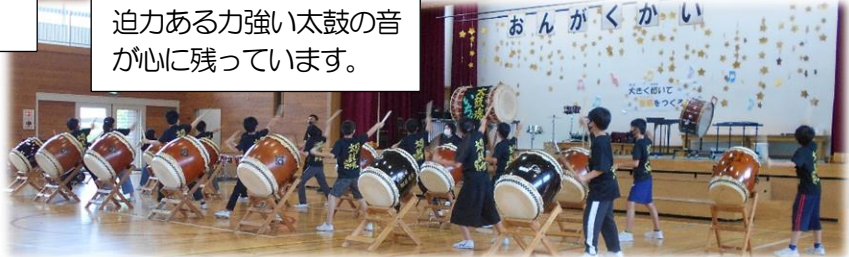
迫力ある力強い太鼓の音が心に残っています。