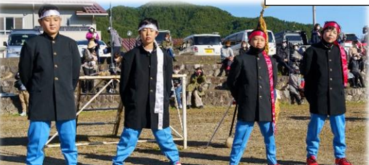
運動発表会を盛り上げた応援団長の声は校庭中に響き渡りました。