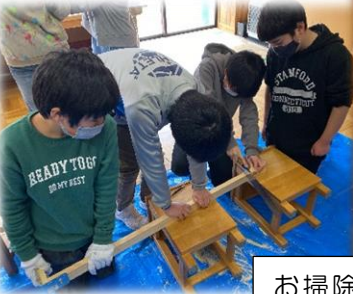
お掃除のやり方教えてくれてありがとう