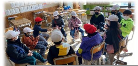
スタッフでの屋内遊びや燻製活動。試し燻製や、準備など縁の下の力持ちになって支えてくれました。