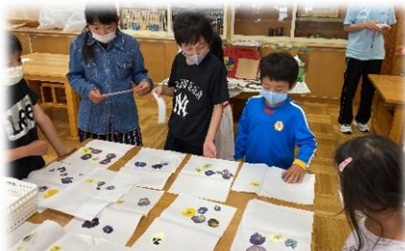
今年はさまざまな児童会企画を計画・運営してくれました。先生との打ち合わせ、準部品の作成、説明など、本当によくやってくれたね。