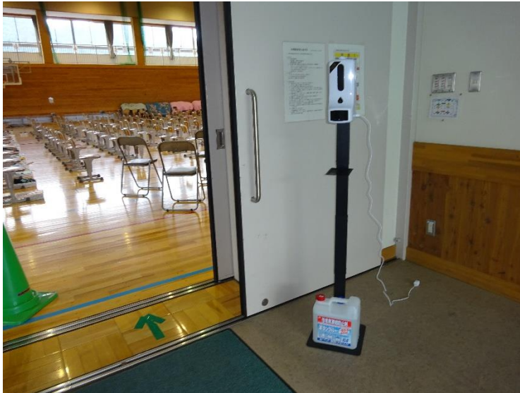
参観日や行事、PTA会合時には検温と消毒ができる器械を設置。