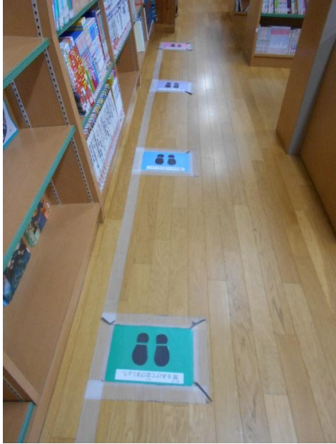
室内にも密にならないで待つ表示