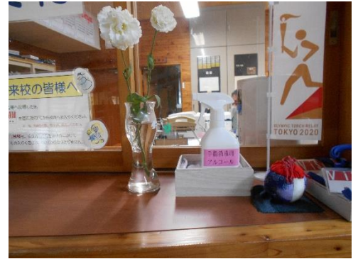
事務室受付口や、昇降口には消毒用ボトル設置。