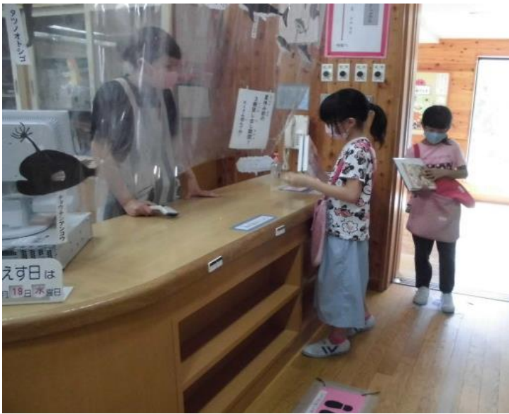
カウンターには飛沫防止シート