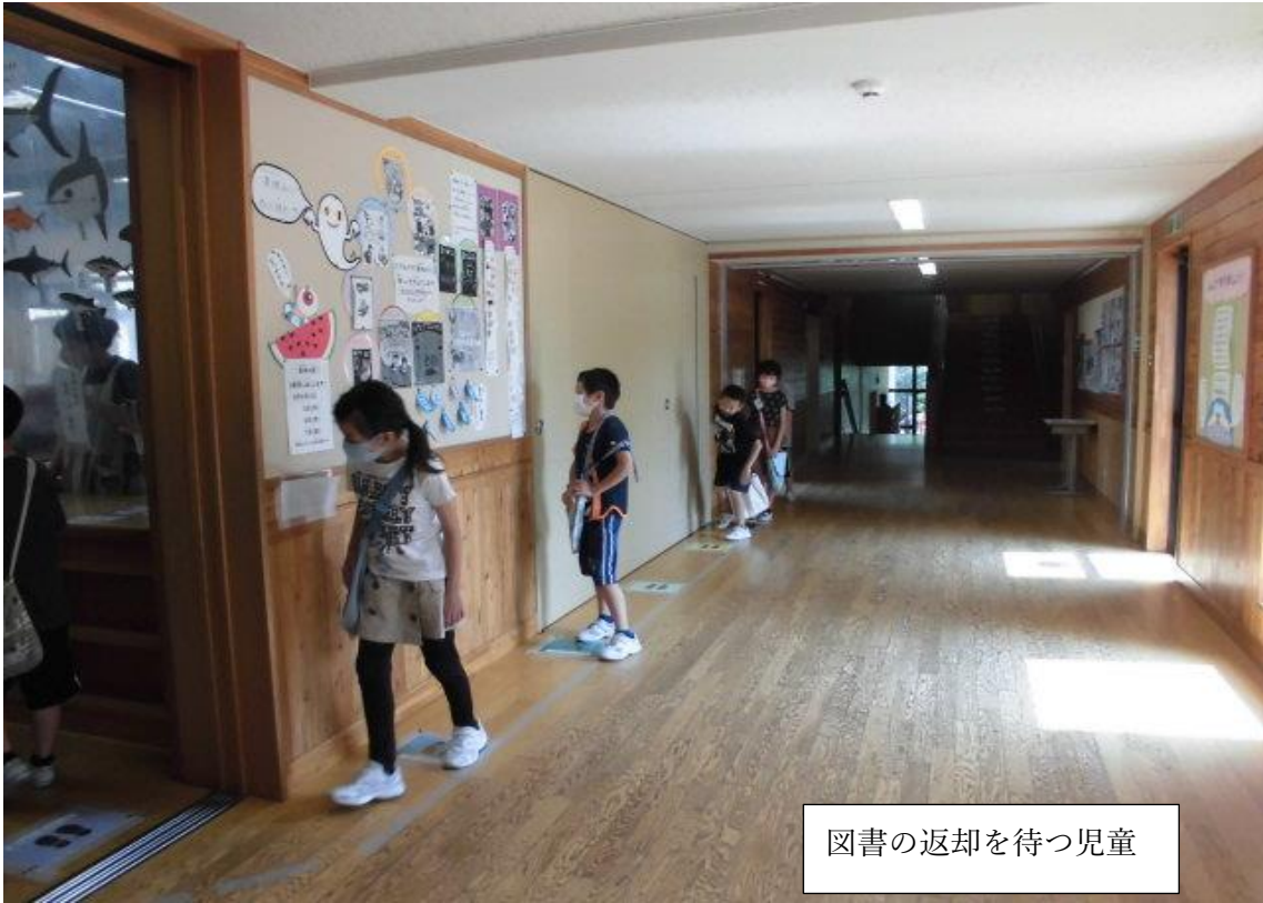
図書の返却を待つ児童