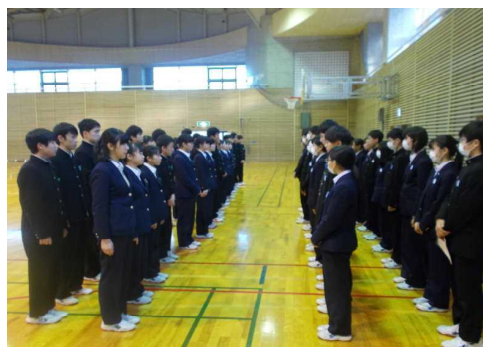
【 3年役員から2年役員へ挨拶 】

3年生から生徒会を引き継いで、もう1ヶ月がたちました。生徒会委員会の運営など最初は慣れずに大変だったと思いますが、最近は日常活動もスムーズに行われており、2年生に頼もしさを感じています。もうすでに以下のような活動も考えてもらっています。2月3日(月)の生徒会委員会では、受験間近の3年生の健康管理のため、3年生には6時間目カットで早退してもらい、1・2年生のみでの委員会も経験しました。