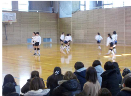
【女子バレーボール部の発表】