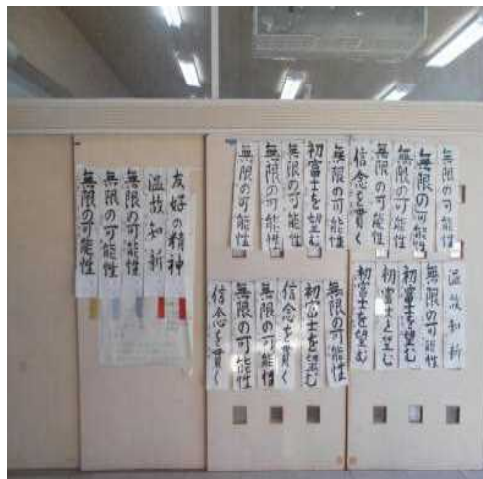
【 校内書き初め展の作品 】

現在のところ本校ではインフルエンザや胃腸炎に罹って出席停止となっている生徒はいますが、学級閉鎖等の措置はとらずに済んでいます。引き続き、健康管理に全校で取り組んでいきますので、ご家庭でもご協力をお願いします。学校では、忙しい中でもやるべきことはきちんと行い、本年度のまとめと卒業式の準備を着実に進めていくように努力して参ります。