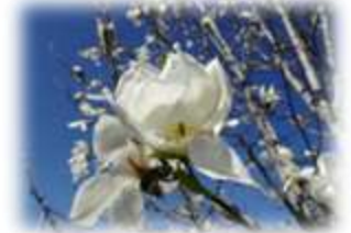
本校のシンボル樹 純情の花