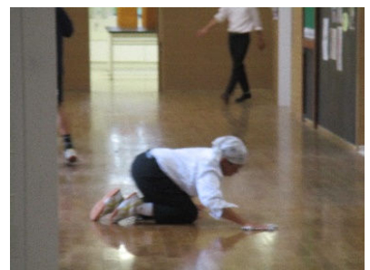
丁寧に床を磨き込む清掃