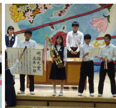
明倫大賞を表彰した閉祭式