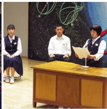
堂々と主張した意見文発表