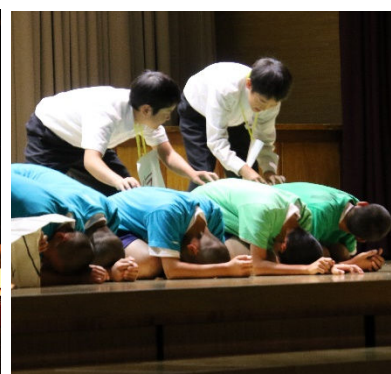
工夫を凝らした総合発表