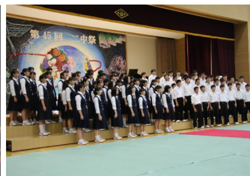
心に響いた3年生の学年合唱