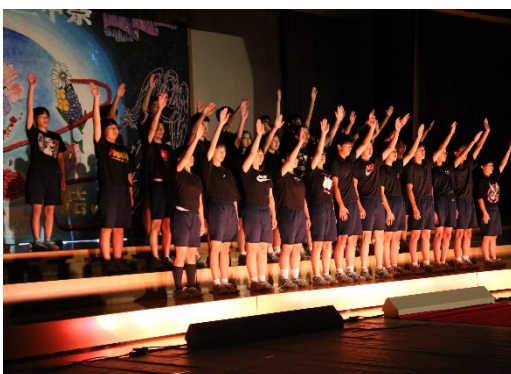
全校で気持ちを高めた開祭宣言