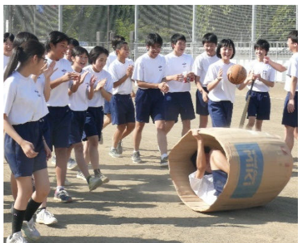
友を精一杯応援した運動会