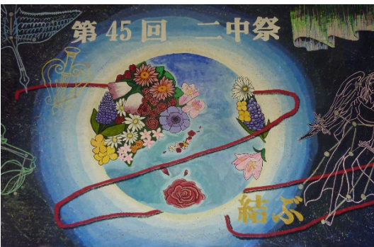
「結ぶ」を表現したステージバック