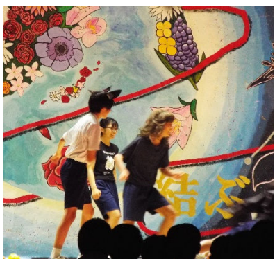
ツナゴンボールから始まった開祭式

保護者、地域の皆様のお力添えに支えられ、二中祭の新たな1ページを今年も築き上げることができました。ご理解とご協力、本当にありがとうございました。