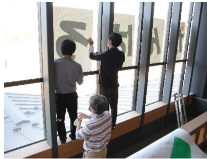
学校からエールを送りたい

その結果、「各ご家庭にて、学習内容が理解できる授業補習のためのプリントを教科毎に作成する」「学習の進め方を動画を通して配信する」「下駄箱をポスト代わりにするために磨いて、新たな課題を取りに来て頂く」等の取組をしてきました。