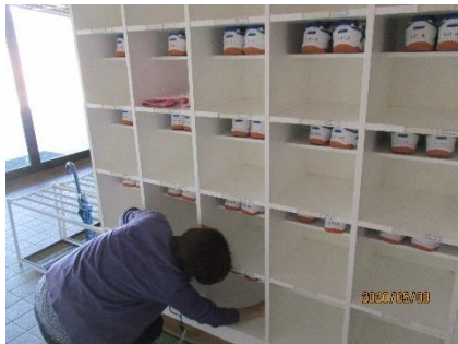
市内感染者の報告を受け、 下駄箱をレターボックスに

約一ヶ月半に渡って余儀なくされてきた臨時休業校中の間、二中の先生方も、生徒の皆さんにどのような学びの場をつくることができるのか、いかに感染予防のための環境を作ることができるのか、職員会を繰り返しながら、考え合ってきました。