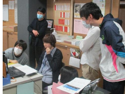
「Zoom」を利用した学級会

また、「担任の先生方と生徒の皆さんを繋いでいこうと『Zoom』を活用して学活をする」「生徒の皆さんがいつ登校してもよいように、定期的に掃除や草取りをする」「二中區に留まらず上田市全体に思いを広げようと横断幕を作成して、昇降口上のガラス窓に掲示する」さらに、「もし突然安全に生徒の皆さんに下校してもらう必要が発生したとき、保護者の皆様にもどのように引き渡しをすればよいのか計画案を立て、実践練習してみる」など、先生方の考え抜いた方法を生かした取組をしてきました。