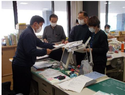
引き渡し訓練の様子