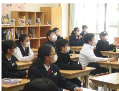
テレビ放送での交通安全教室

第1回避難訓練では、災害や非常事態が発生した時に安全かつ迅速に避難することができるように、避難経路と避難場所の確認、避難の仕方等を確認しました。校長先生から「学校で一番大切なものは、皆さんの命。その命を守る訓練を真剣に行うことができよかったです。」というお話をいただきました。いざという時のために、自分や相手の命を守るよう行動していきましょう。