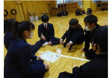
グループエンカウンターの様子

今日も声をかけてくれて友達になる人がいてよかったです！明日もクラスの人とたくさん話して友達になれればいいと思います。明日はテスト！自分の力を発揮できるように頑張りたいです！！