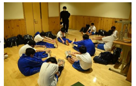
各部の活動の様子