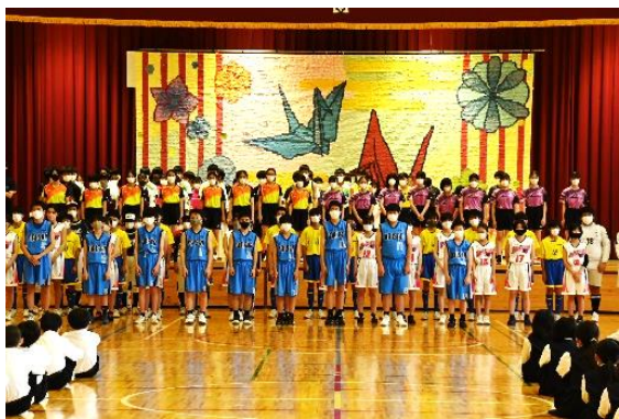
選手団の勇ましい姿