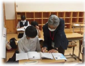
学習ボランティアさんに質問の様子