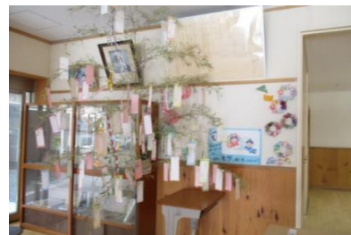
昇降口近くの七夕飾り