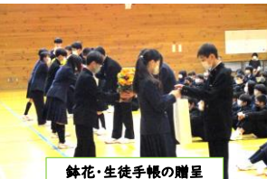
鉢花・生徒手帳の贈呈