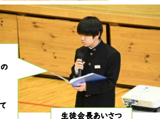
生徒会長あいさつ

「生徒会は、生徒が中心となって 活動します。1、2、3年生一人ひとりの 取り組みが、三中の力となります。 今年度のスローガンは 「Palette(パレット)」です。 一人ひとりが手を取り合い、協力して 取り組みましょう!」