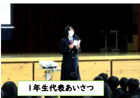
1年生代表あいさつ