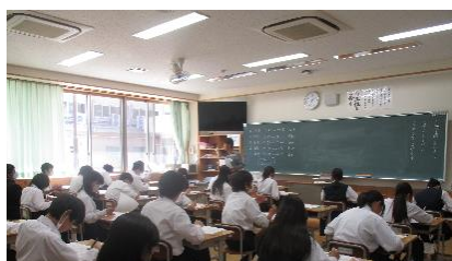
中間テスト、頑張っています！

毎週水曜日の放課後、信州型コミュニティスクール「第三中応援団」の活動による放課後学習「スイッチ」が行われています。水曜日の「水」地域の「地」に加え、学校から地域に学びの場を「スイッチ」という意味を込めて、「スイッチ」と命名しています。先週は、1・2年生の2学期中間テスト直前ということで、2日(月)の「げつっち」3日(火)の「かよっち」も合わせて3日間行いました。日を追うごとに人数は増え、4日(水)の「スイッチ」では全学年40名が参加し、急遽、地域連携室も開放して行いました。生徒たちが自ら進んで学ぼうとする姿、素晴らしいです。子どもたちの学習習慣形成の場として、また「居場所」の一つとして、今後も継続していきます。「第三中応援団」の皆様、いつもありがとうございます。今後ともよろしく願いいたします。