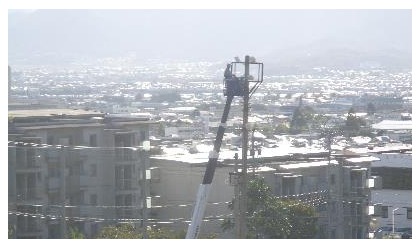
校内 LED 化工事が完了しました。 大切に使いましょう。