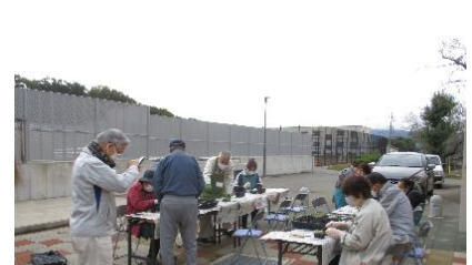
花ボランティア活動、 ありがとうございました！