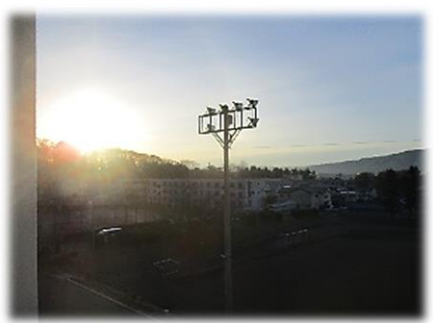
1/6(金) 晴天の3学期初日、全48日間の学校生活がスタート