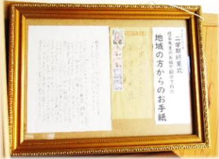
お手紙は額に入れて昇降口に掲示しています。

新しい年を迎え、決意を新たにしたいと思えます。コロナ対策をしっかりして、3年生は、進路に向けて、勉強してください。あきらめずにやり通してください。2年生は、生徒会を引継ぎ、学校を引っ張る準備、1年生は先輩になる準備をしてください。