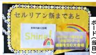
カウンタダウンボード(当日)