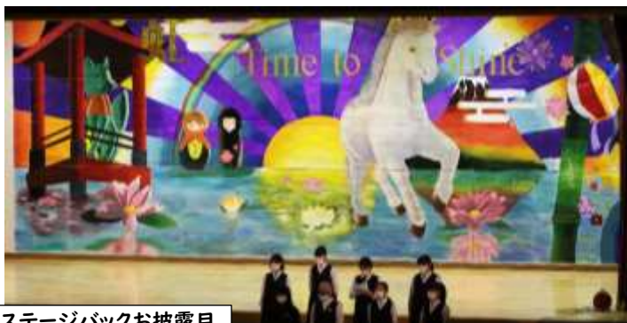
ステージバックお披露目

9月22日(木)・23日(金・祝)に第53回セルリアン祭を実施しました。生徒会役員を中心に1学期から企画・準備が始まり、夏休み明けからは全校が本格的に準備・活動しながら当日を迎えました。あいにくの天候のため、1日目の午後の体育祭は順延となってしまいましたが、合唱コンクールでは学年の発表ごとに換気を行うなど、感染対策に十分配慮しながら、コロナ禍の中では初めて、体育館でのイベントを全校生徒が一同に会して実施しました。その