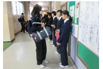
朝の募金活動の様子

大きな爪痕を残した台風19号の通過から1ヶ月が過ぎました。県内各地では復興に向けた取組が急ピッチで進められています。生徒会の福祉委員会では少しでも復興のお役に立ちたいという生徒の願いから募金活動を始めました。一日も早い真の復興を祈念します。