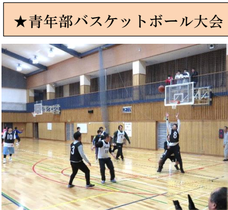
他校の青年部職員チームと共にバスケットボールの試合を通して交流を深めました。