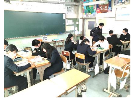
数学(机を合わせて少人数学習)