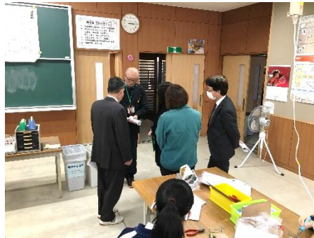
技術(教材の説明) 懐中電灯