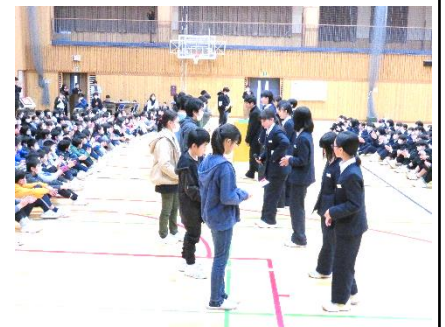
プレゼントの贈呈