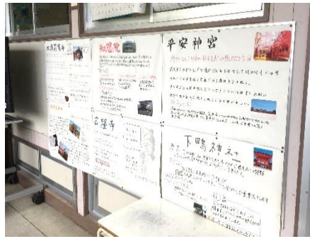
修学旅行見学地の調べ学習の様子

2年生の各クラスで、昨年の2学期から取り組み始めた修学旅行の学習の様子。廊下には各班ごと写真を入れたり見出しを工夫したりしながら作成した模造紙が展示されています。またクラスマッチ形式で修学旅行検定などをおこなっています。