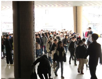
小学校6年生を引率して体育館へ