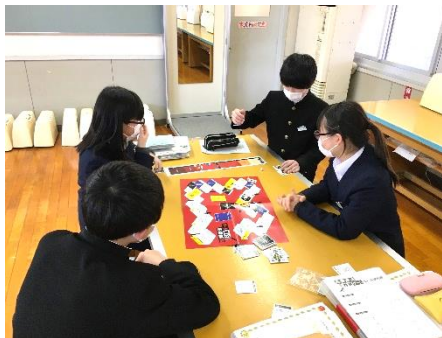
家庭科(悪質商法対策ゲーム)