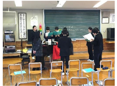
音楽(大地讃頌のパート練習)