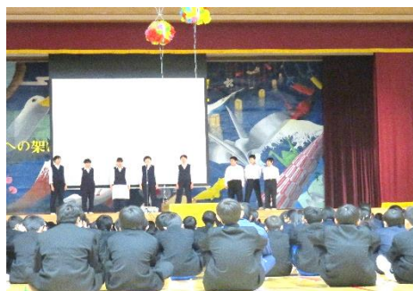
中学校生活の説明