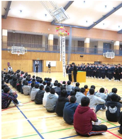
4月の入学を心待ちにしています。