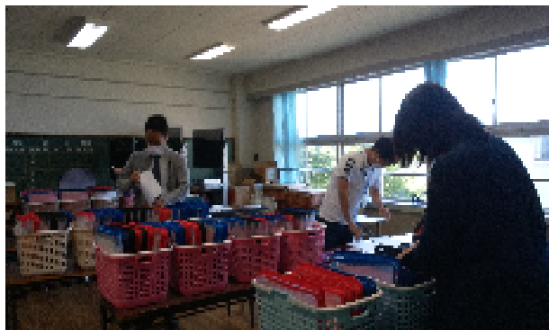
配布物準備の様子