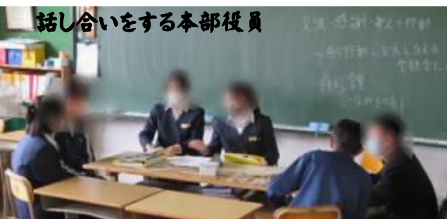
話し合いをする本部役員

民主的な手続きを学ぶ大事な機会となる生徒総会。今回は放送で行いました。「コロナ禍で思うように人と会えなかったり、行動が制限されたりといった時代だからこそ、人と人との心の繋がりを意識し、お互いを見つめる機会を大切にしたい」という願いが生徒会長から発表され、令和3年度の生徒会スローガン「Relationship ～繋がりから広がる感謝の輪～」が賛成多数で承認されました。