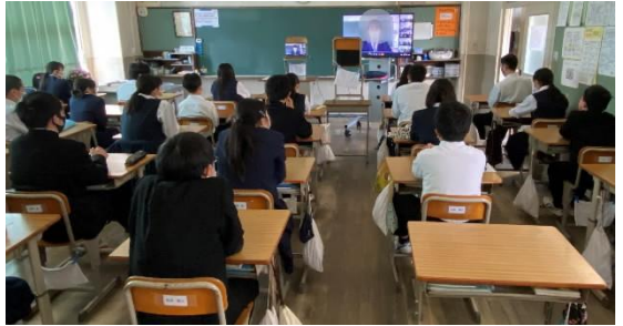
写真 左：職員入室練習（1年） 中：仲間探しゲーム（1年） 右：Google meetでの2学年集会