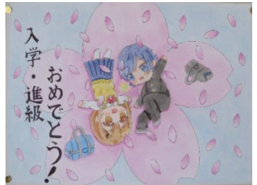
← 美術部黒板アート&作品