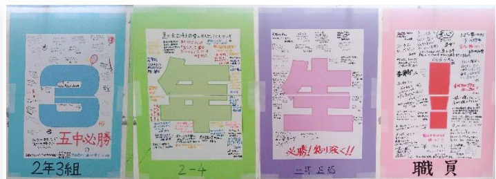
3年生の廊下に掲示された 1,2年生と職員からのメッセージ