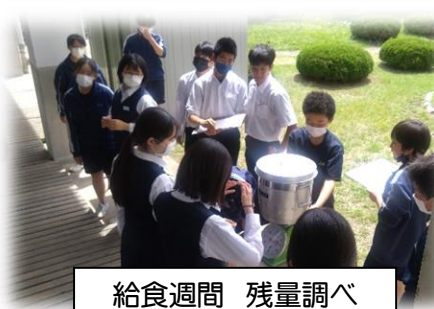
給食週間 残量調べ