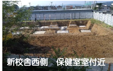
新校舎西側 保健室室付近