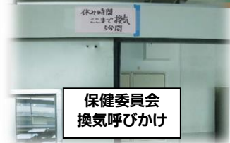
保健委員会 換気呼びかけ