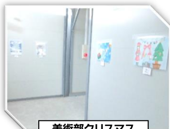
美術部クリスマス イラストコンテスト