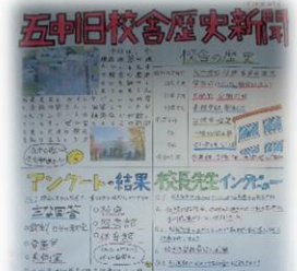
つばさ新聞委員会 五中旧校舎歴史新聞