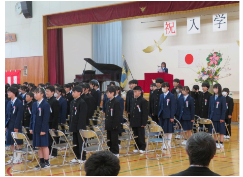
フレッシュな148名の新入生が入学

全世界人口80億人、日本だけでも1億2千万人もいる中で、私たちがここでこうして出会えたことは奇跡に近いと言っても過言ではありません。新年度の新しい出会いに感謝しながら、みんなで力を合わせて、本年度の第六中学校を盛り上げていきたいと思っております。1年間よろしくお願いたします。